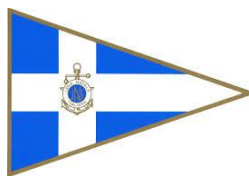
Lega Navale Napoli