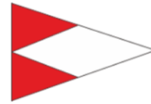
Club Nautico della vela