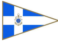
Lega Navale Napoli